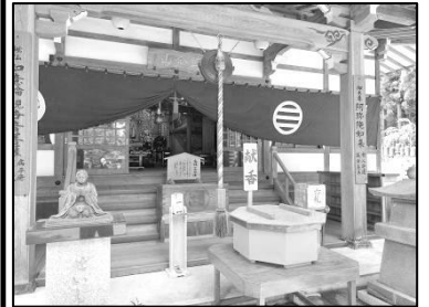
以前より幅広く、本式に