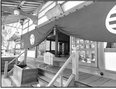
色が鮮やかになりました

お盆やお彼岸、十夜や年末年始など、お寺の行事の際に飾られる、本堂正面の「陣幕(じんまく)」が、約五十年ぶりに新調されました。お檀家の方々から「何かにお役立て下さい」と頂きましたご浄財を活用させて頂いたおかげで、今回は、二十九世住職の晋山(しんざん)住職(就任)記念として作らせていただきました。ありがとうございました。合掌